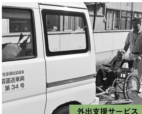
外出支援サービス