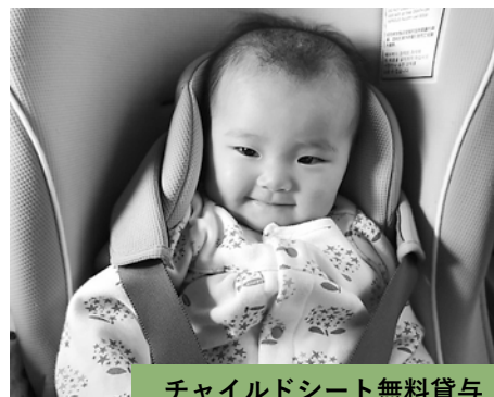
チャイルドシート無料貸与